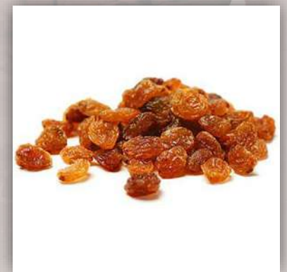
Raisin sec 12 €/kg