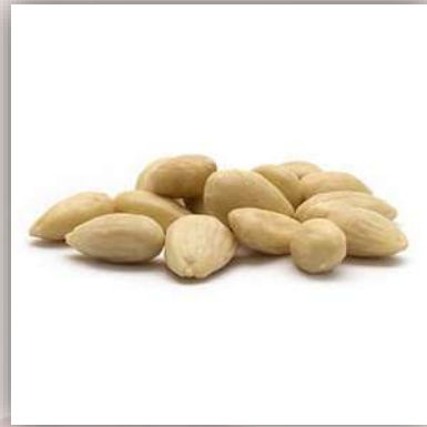
Amandes émondées 22 €/kg