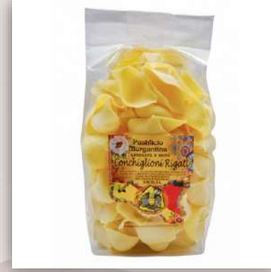
Conchiglioni de blé Sicilien Fait à la main Méthode à l'ancienne 4.00 €/500gr