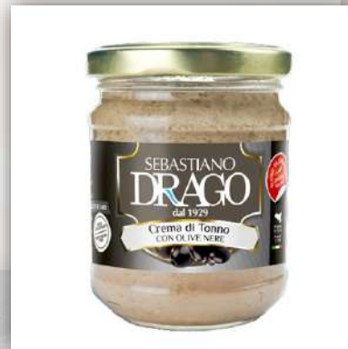
Crème de thon aux olives noires 7 €/180gr