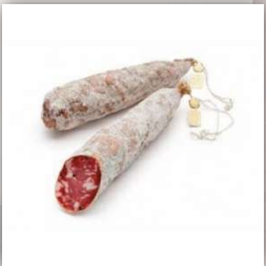
Salami nature artisanal 11 €/250gr