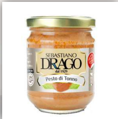
Pesto de thon 7€/180gr