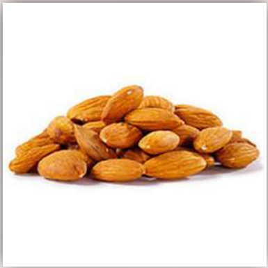
Amandes sans coques 20 €/kg