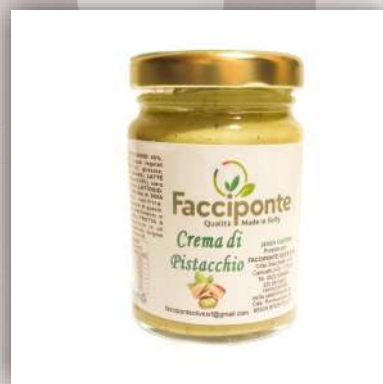
Crème de pistache 5 €/100gr