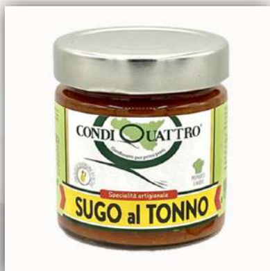
Sauce tomate au thon 6.50 €/200gr