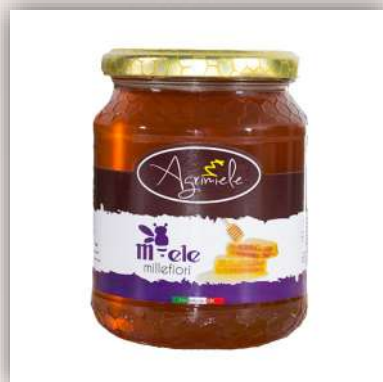
Miel artisanal différentes saveurs selon la saison 11 €/400gr