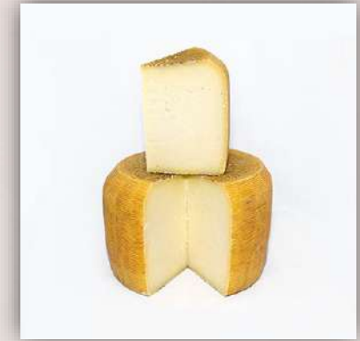
Pecorino semistagionato nature