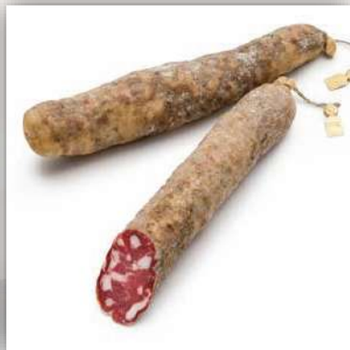
Salami nero dei Nebrodi cochon noir fabrication artisanal sans additif 25 €/500gr