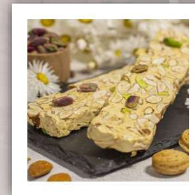
Torrone Sicilien Nougat aux amandes, pis- taches et miel de fleur d'oranger 11 €/200gr vendu par 3