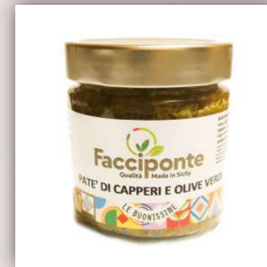
Tapenade Tomate sèche câpre et anchois 7 €/180 gr