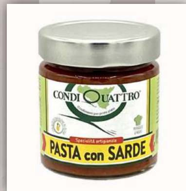
Sauce tomate au sardine 6.50 €/200gr