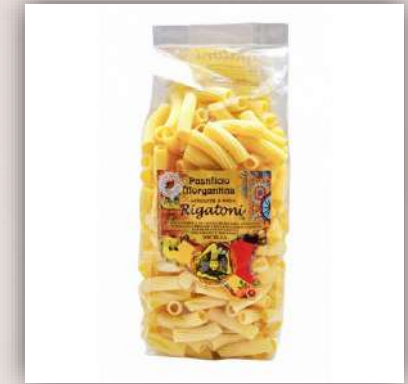
Rigatoni de blé Sicilien bio Fait à la main Méthode à l'ancienne 4.00 €/500gr