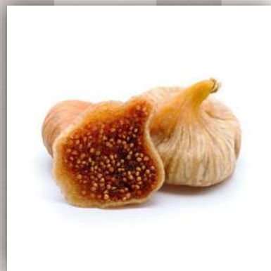
Figues sèches 17 €/kg