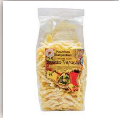
Busiata corte de blé Sicilien Fait à la main Méthode à l'ancienne 4.00 €/500gr