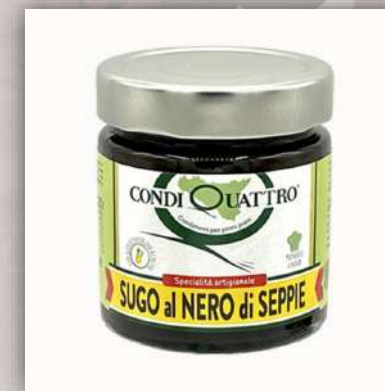
Sauce au noir de seiche 6.50 €/200gr