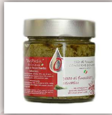
Pesto de fenouil sauvage 8 €/200gr