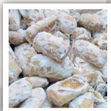
Taralle glaçage au citron de Sicile 24 €/kg