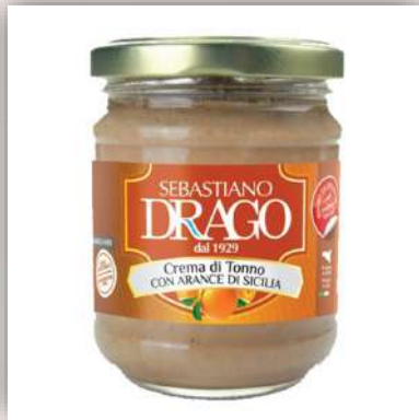
Crème de thon aux agrumes 7 €/180gr