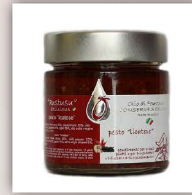
Pesto Licatesse aux olives noires 8 €/200gr