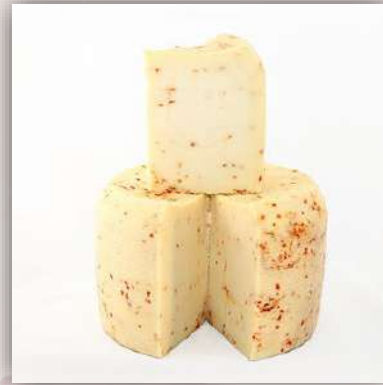
Pecorino primosale au piment