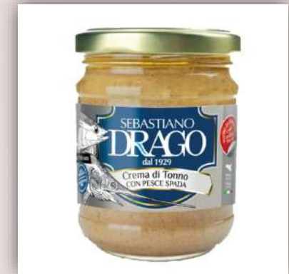
Crème de thon et D'espadon 7 €/180gr