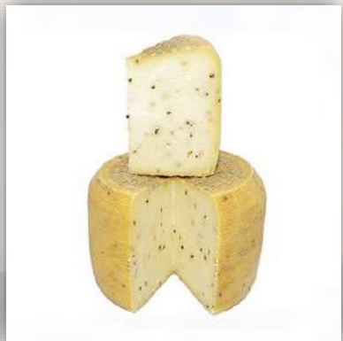
Pecorino semistagionato au poivre (6 mois)