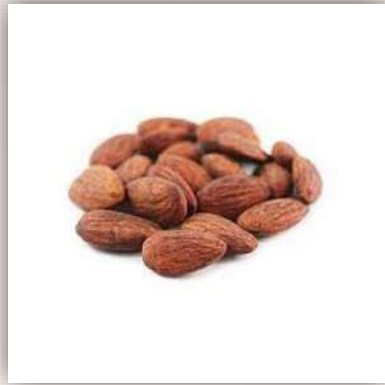
Amandes toastées 22 €/kg