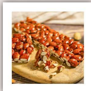
Croquant aux amandes Siciliennes toastées 8.50 €/200 gr vendu par 3