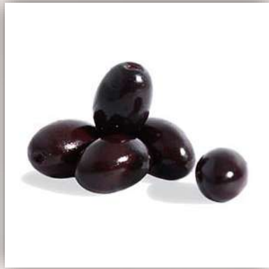
Grosses olives noires