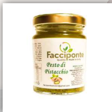
Pesto de pistache 6.50 €/100 gr