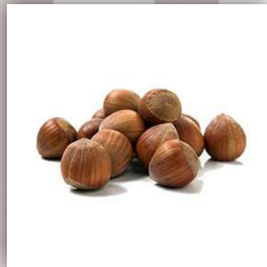
Noisettes 11 €/kg