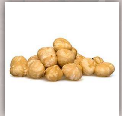
Noisettes toastées 20 €/kg