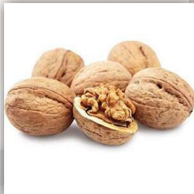
Noix 10 €/kg