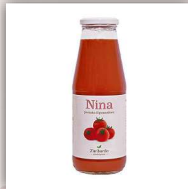
Passata de tomate Nina

100% naturel 700 gr vendu par caisse de 12 bts