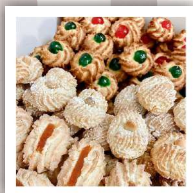
Mix de biscuits artisanaux aux amandes sans conservateurs ni additifs 35 €/kg 18 €/500gr