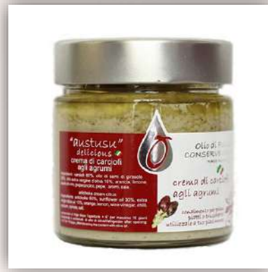
Crème d'artichauts aux agrumes 8 €/200gr