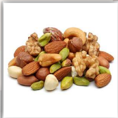
Mix fruits secs 22 €/kg