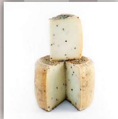
Pecorino stagionato au poivre (12 mois)