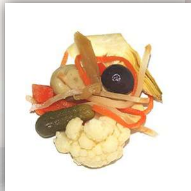
Antipasti de légumes à l'huile