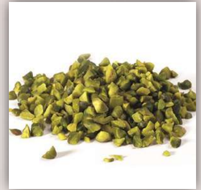
Pistaches concassées 40 €/kg