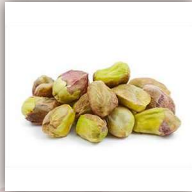
Pistaches décortiquées 62€/kg