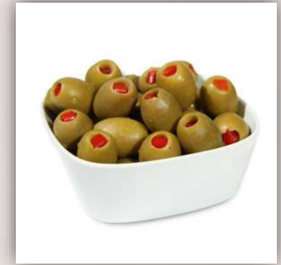
Olives farcies aux poivrons