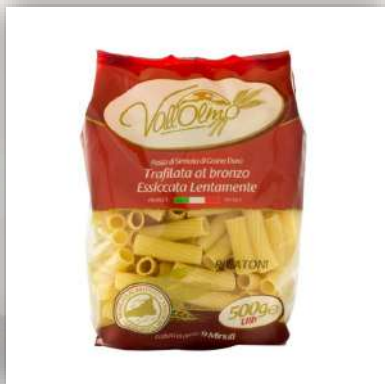
Rigatoni ou penne pâte artisanale de blé Sicilien 2.70 €/500gr