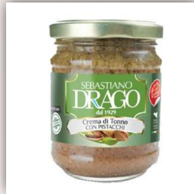
Crème de thon aux pistaches 7 €/180gr