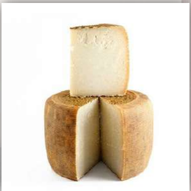
Pecorino stagionato nature (12 mois)