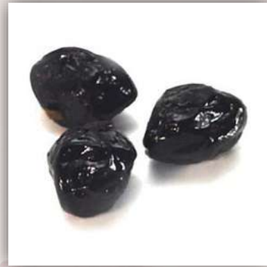
Olives à la grecque