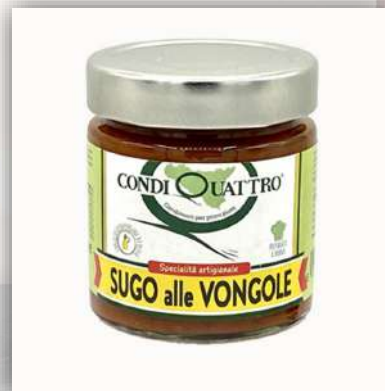
Sauce tomate au vongole 6.50 €/200gr