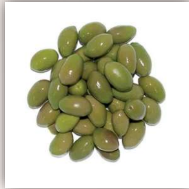
Grosses olives vertes