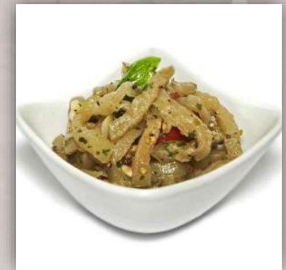
Aubergines à l'huile