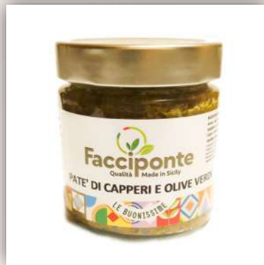
Tapenade Câpre et olive verte 7 €/180gr