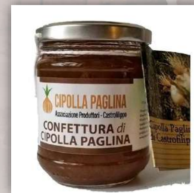
Confit d'oignons AOP de Castrofilippo 6.50 €/220gr