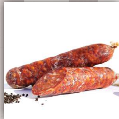
Salami piquant artisanal 11 €/250gr