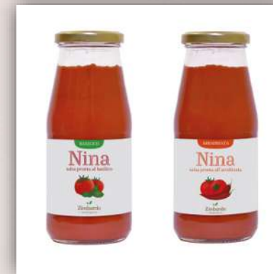
Sauce tomate prête