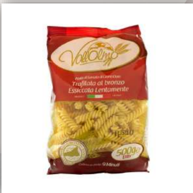
Fusilli ou Caserecce pâte artisanale de blé Sicilien 2.70 €/500gr