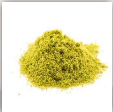
Pistaches en poudre 35 €/kg