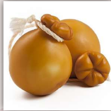
Provola fumée 12 €/500gr