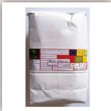
Farine intégrale BIO de blé ancien moulu à la meule de pierre 4,50 €/kg