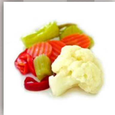
Jardinière de légumes