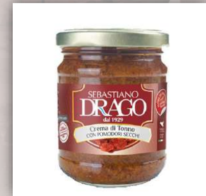
Crème de thon aux tomates séchées 7 €/180gr