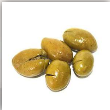
Olives vertes écrasées