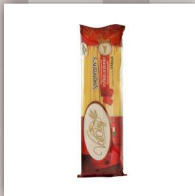
Linguine ou Spaghetti pâte artisanale de blé Sicilien 2.70 €/500gr