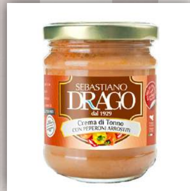
Crème de thon aux poivrons rôtis 7 €/180gr