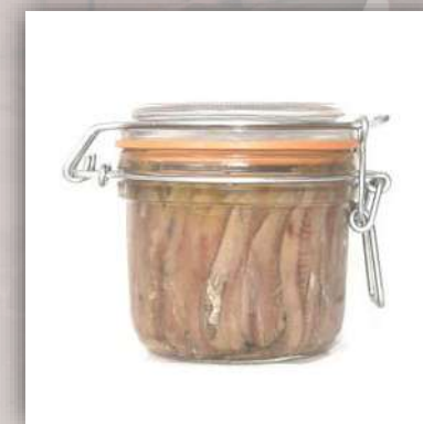
Filets d'Anchois sous huile