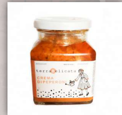
Crème de poivrons Sauce pour pâtes, bruschetta 8 €/260gr