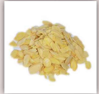
Amandes effilées 21 €/kg