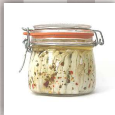
Filets d'Anchois marinés