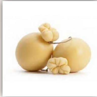
Provola 12 €/500gr