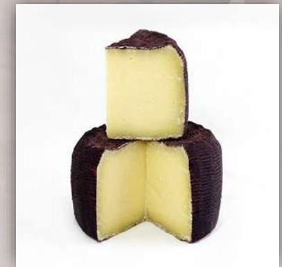
Pecorino vinello affiné dans le vin Nero d'Avola