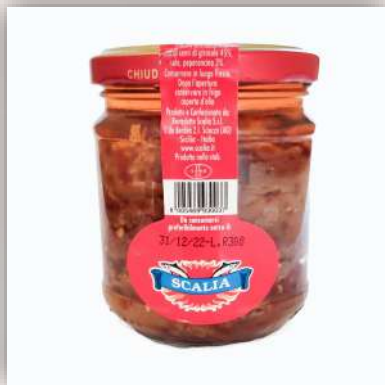
Filet d'anchois au piment 9 €/230gr