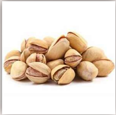
Pistaches crues 17 €/kg