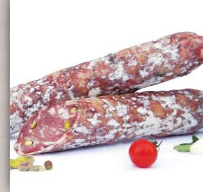
Salami pistache artisanal 11 €/250gr