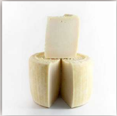
Pecorino primosale nature (frais)