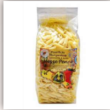
Mezze penne de blé Sicilien Fait à la main Méthode à l'ancienne 4.00 €/500gr