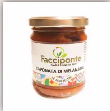
Caponata sauce Sicilienne aigre-douce aubergine et divers légumes en accompagnement 4.50 €/190gr