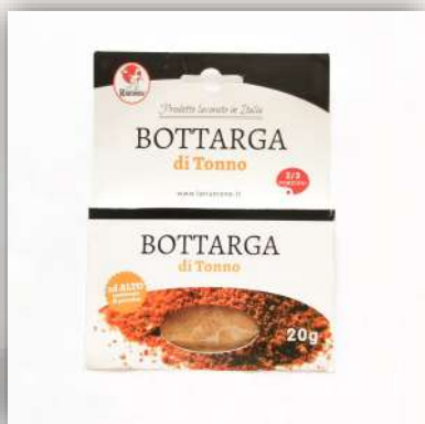
Bottarga de thon Condiment poudre d'œuf de thon 5 €/20gr