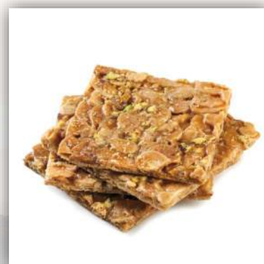
Croccantini tuiles aux amandes, miel et pistaches 18 €/500gr 35 €/kg