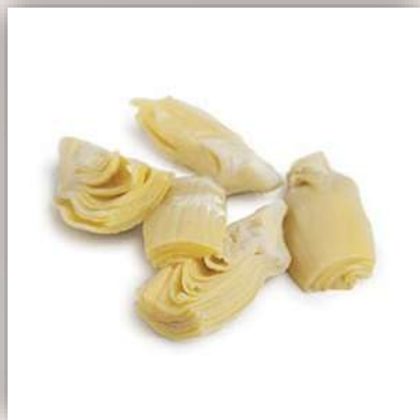
Artichauts sous huile