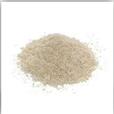
Amandes en poudre 21 €/kg