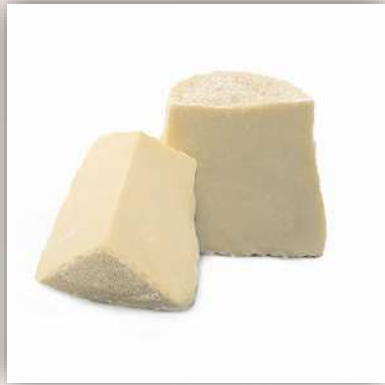
Ricotta salée 18 €/kg