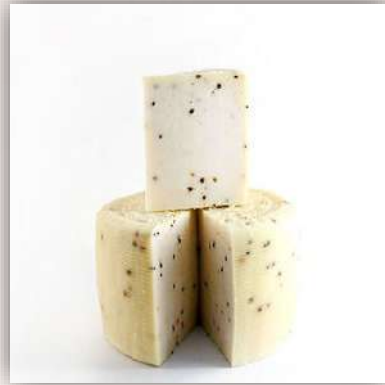
Pecorino primosale au poivre