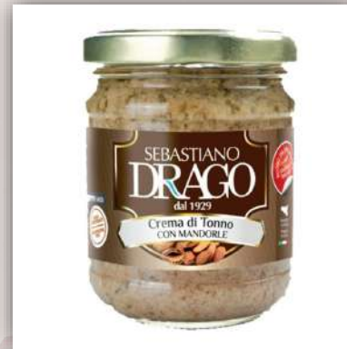
Crème de thon aux amandes 7 €/180gr