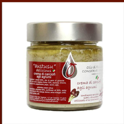
Crème d'artichauts aux agrumes 8 €/200gr