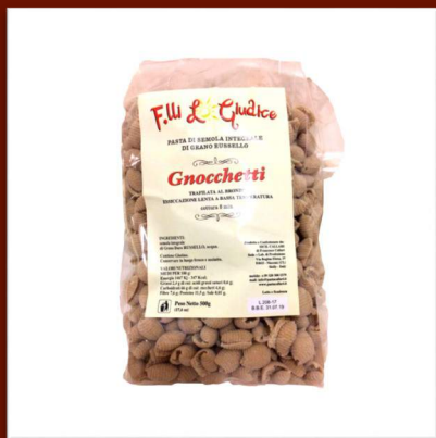
Gnocchetti de farine intégrale sans additif méthode à l'ancienne 4.70 €/500gr