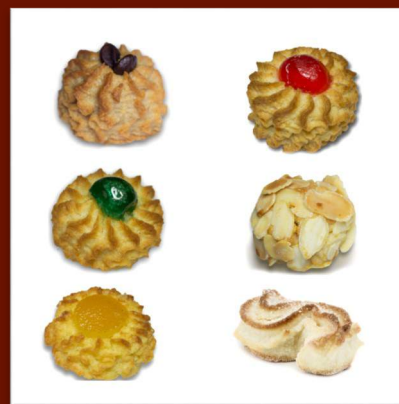
Mix de biscuits artisanaux