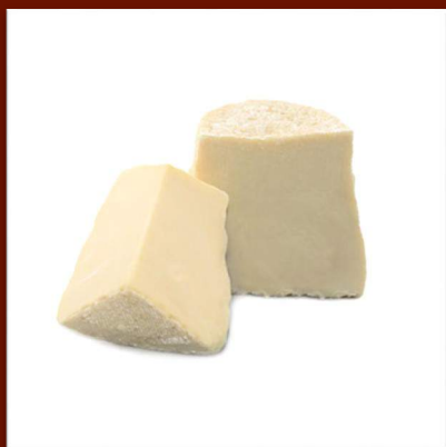
Ricotta salée 15 €/kg