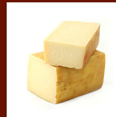
Ragusano fromage (au lait de vache) caciocavallo stagionato 12 mois 22 €/kg