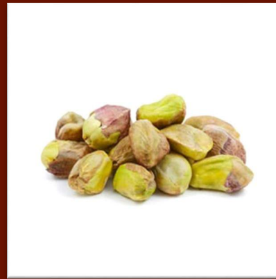
Pistaches décortiquées 40 €/kg