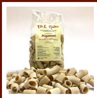
Rigatoni de farine intégrale 4.70 €/500gr