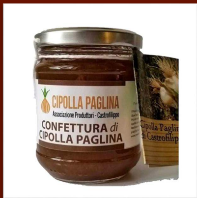
Confit d'oignons AOP de Castrofilippo 6.50 €/220gr 4.50 €/100gr