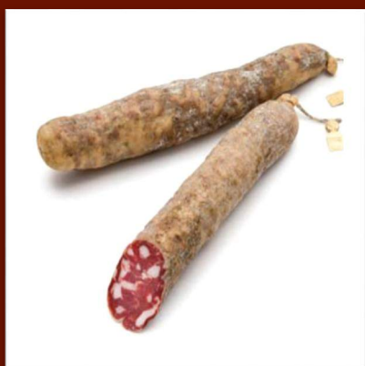
Salami nero dei Nebrodi cochon noir fabrication artisanal sans additif 25 €/500gr