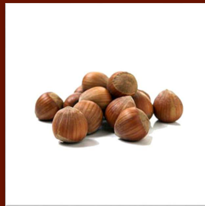
noisettes 11 €/kg