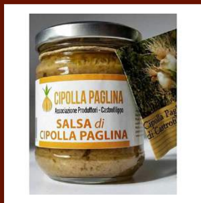
Sauce à l'oignons AOP de Castrofilippo 6.50 €/180gr