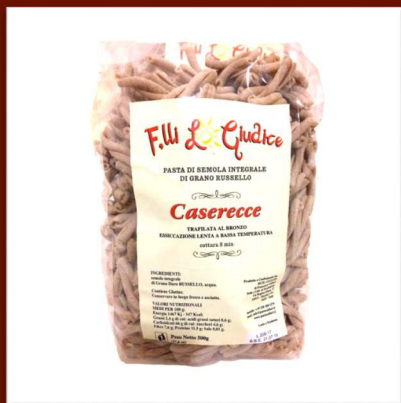
Caserecce de farine intégrale 4.70 €/500gr