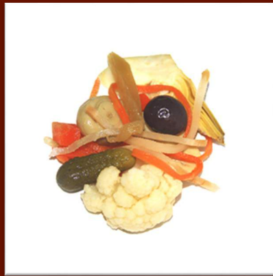
Antipasti de légumes à l'huile