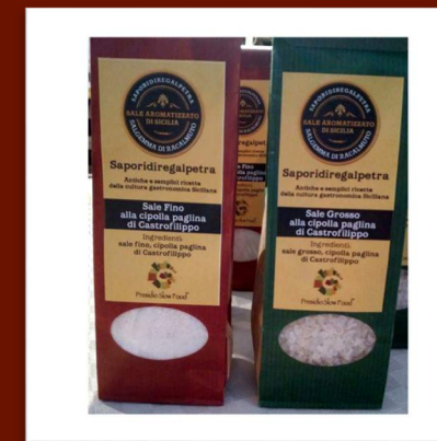
Sel (gros et fin) aromatisé aux oignons AOP de Castrofilippo 6 €/180gr