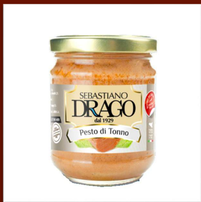
Pesto de thon