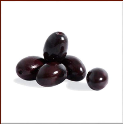
Grosses olives noires