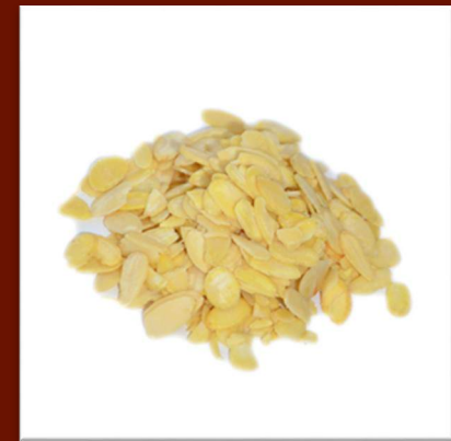
Amandes effilées 19 €/kg