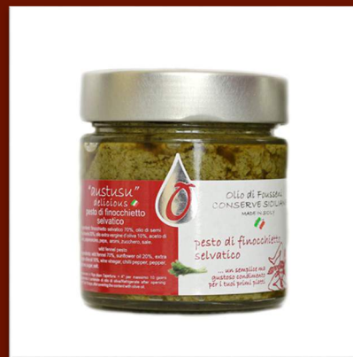
Pesto de fenouil sauvage 8 €/200gr