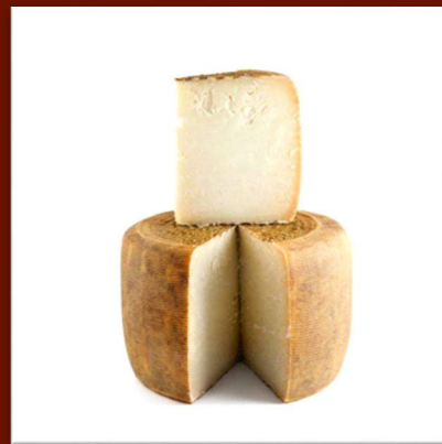
Pecorino stagionato nature (12 mois)