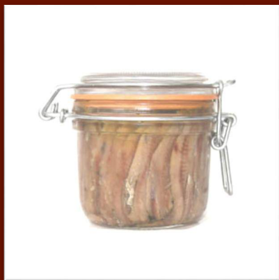
Filets d'Anchois sous huile