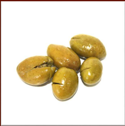
Olives vertes écrasées