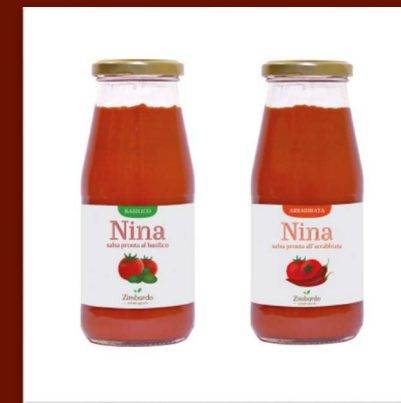
Sauce tomate prête