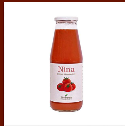
Passata de tomate Nina

100% naturel 700 gr vendu par caisse de 12 bts