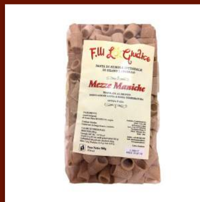
Mezze Maniche de farine intégrale 4.70 €/500gr