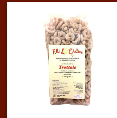
Trottole de farine intégrale 4.70 €/500gr