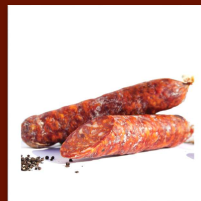
Salami piquant artisanal 11 €/250gr