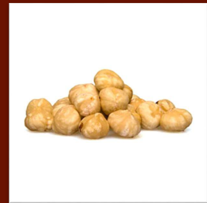
Noisettes toastées 18 €/kg