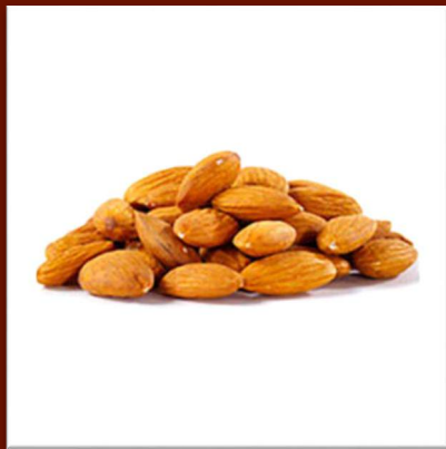
Amandes sans coques 19 €/kg