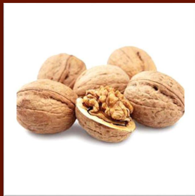
Noix 10 €/kg