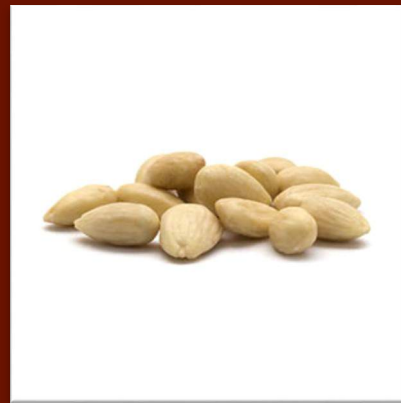
Amandes émondées 21 €/kg