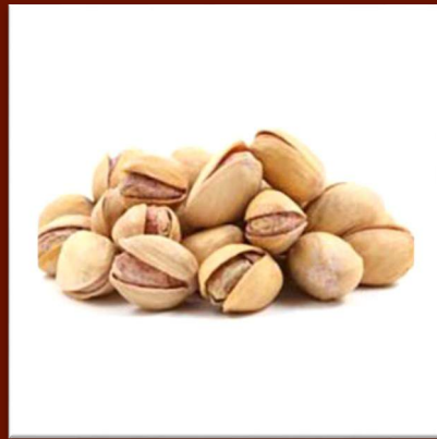
Pistaches salées 23 €/kg