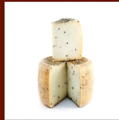
Pecorino stagionato au poivre (12 mois)