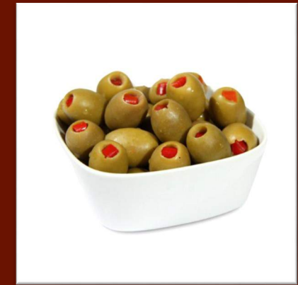
Olives farcies aux poivrons