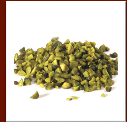
Pistaches concassées 35 €/kg