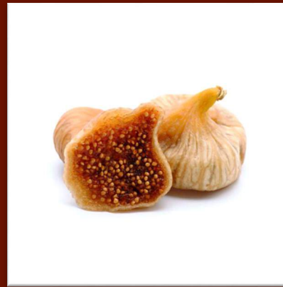
Figues sèches 16 €/kg