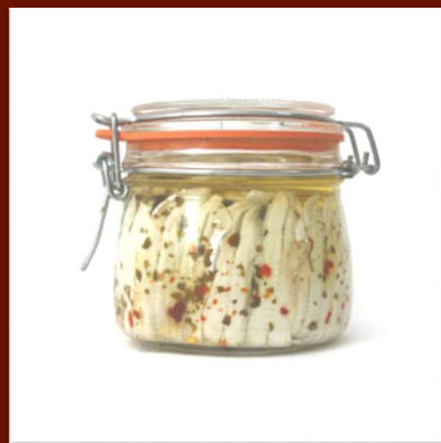
Filets d'Anchois marinés