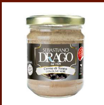
Crème de thon aux olives noires 7 €/180gr