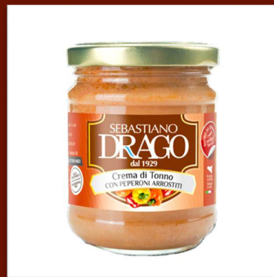
Crème de thon aux poivrons rôtis 7 €/180gr