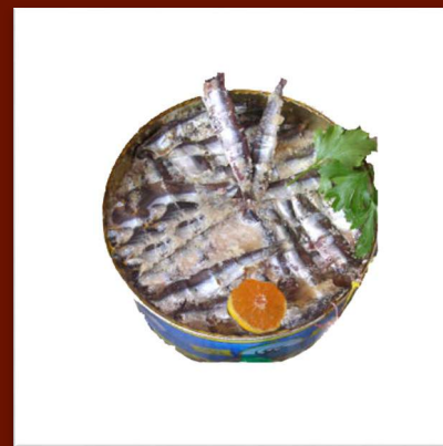
Filets d'Anchois sous sel