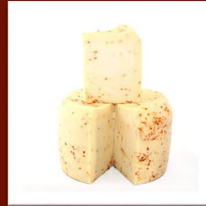
Pecorino primosale au piment