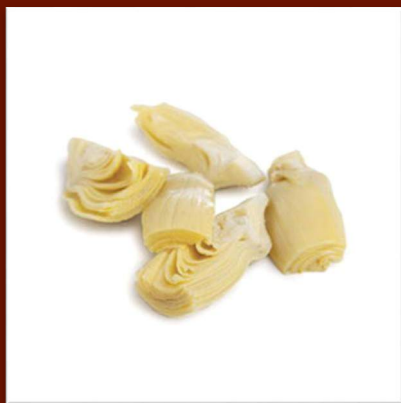
Artichauts sous huile