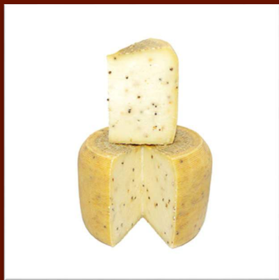
Pecorino semistagionato au poivre (6 mois)