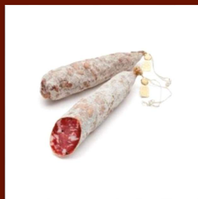
Salami nature artisanal 11 €/250gr