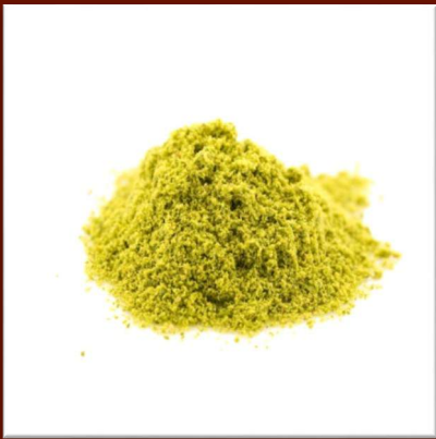
Pistaches en poudre 32 €/kg