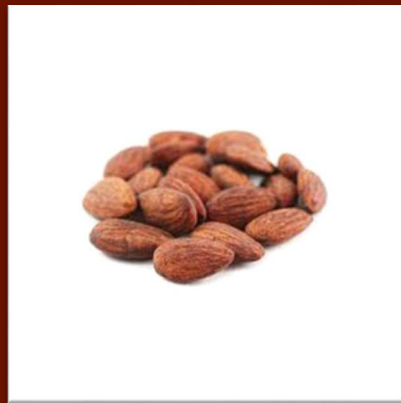
Amandes toastées 21 €/kg