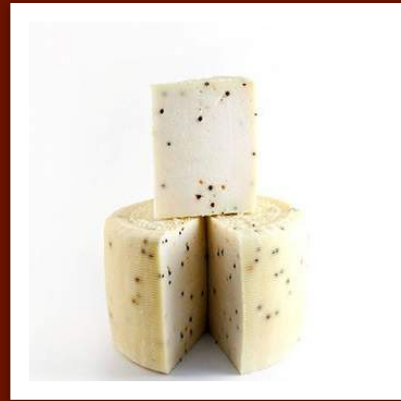
Pecorino primosale au poivre