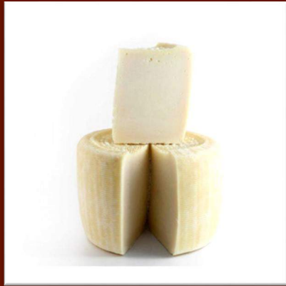
Pecorino primosale nature (frais)