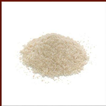
Amandes en poudre 19 €/kg