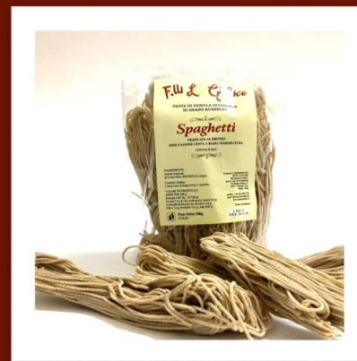
Spaghetti de farine intégrale 4.70 €/500gr