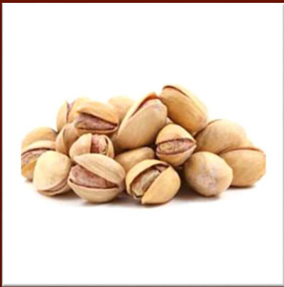
Pistaches crues 17 €/kg