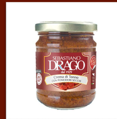
Crème de thon aux tomates séchées 7 €/180gr