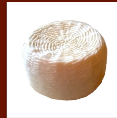
Chèvre primosale nature (frais)