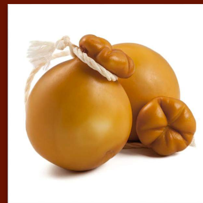
Provola fumée 11 €/500gr