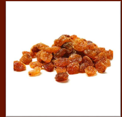
Raisin sec 12 €/kg