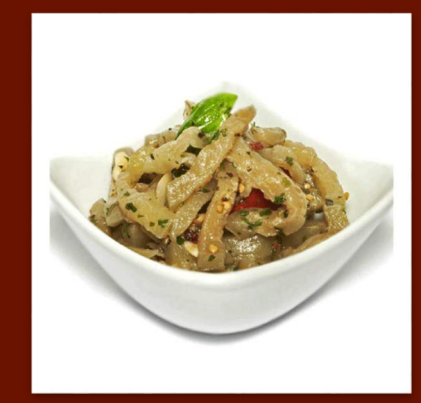
Aubergines à l'huile