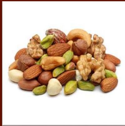
Mix fruits secs 20 €/kg