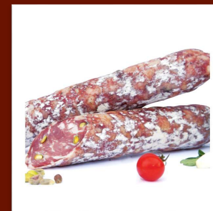
Salami pistache artisanal 11 €/250gr