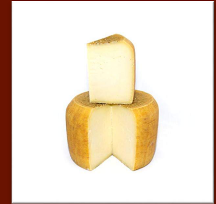
Pecorino semistagionato nature