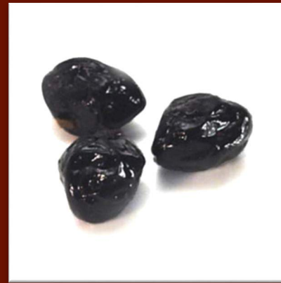
Olives à la grecque