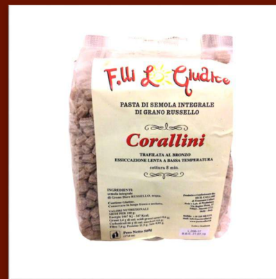
Corallini de farine intégrale 4.70 €/500gr