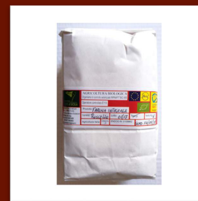
Farine intégrale BIO de blé ancien