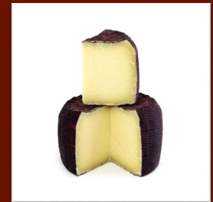
Pecorino vinello affiné dans le vin Nero d'Avola