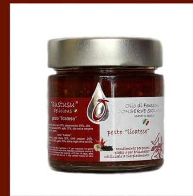
Pesto Licatesse aux olives noires 8 €/200gr