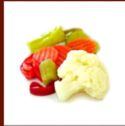
Jardinière de légumes