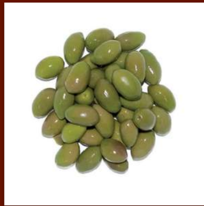
Grosses olives vertes