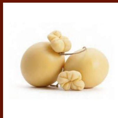
Provola 11 €/500gr